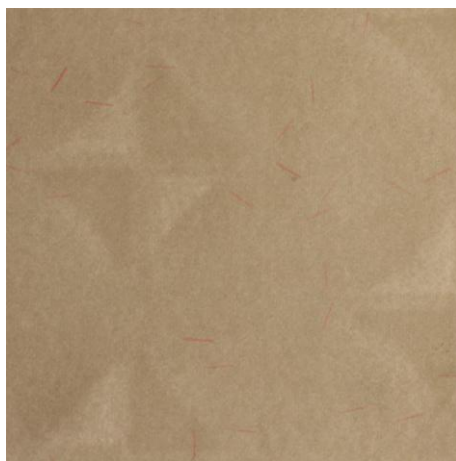
Popierius su vandens ženklų, dvitoniu, nefiksuotu, pasikartojančiu