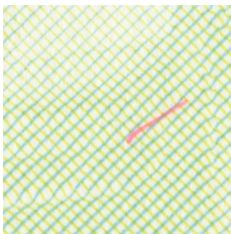
Popierius su įterptais į masę pluoštais, matomais, raudonos spalvos