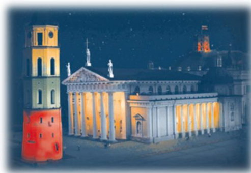
Daugiaspalvis vaizdas, švytintis ultravioletiniuose spinduliuose